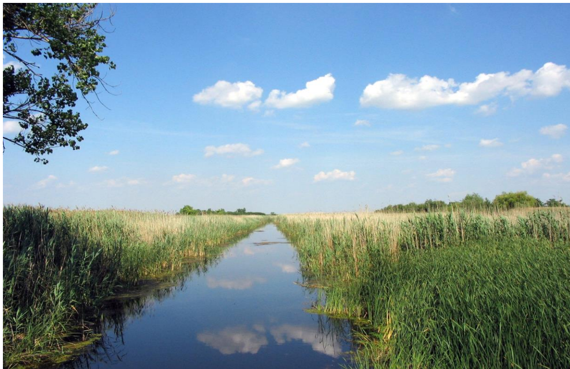
Водоток Јегричка код моста на путу за Бечеј

терасе је уједначена, са благим рељефним облицима. Северни део општине је виши и благо нагнут од севера ка југу. У том северном делу апсолутне надморске висине се креће од 78 до 86 м.н.в. Јужни део општине је више уједначених висина (80 до 82 м), те је овај део благо нагнут ка северу. Стабилност терена општине Темерин зависи од дубине подземних вода. Ниво подземних вода налази се на дубини преко 1,5 метра. Са северне стране општине Темерин протиче водоток Јегричка која је саставни део ХсДТД, и према коме гравитациону отичу површинске воде са територије Општине Темерин. Правац отицања је запад – исток. Дужина канала кроз Темеринску општину износи 15 км.